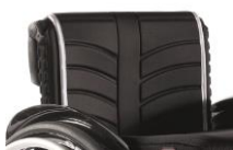
Tapicerka EXO standardowa