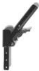
Oparice składane w połowie, do tyłu