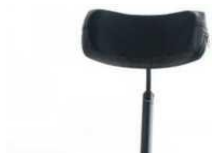
Zagiówek z reg. wysokości, głębokości i kąta