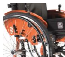
Hamulec zintegrowany z osłoną boczną, Safari