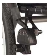
Hamulec na wys. kolan