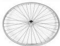
Koło z polerowaną piastą, 36 szprych, splot prosty