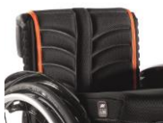
Tapicerka EXO PRO oddychająca