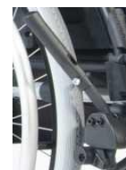
Hamulec jednoręczny, prawy