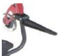
Uchwyt na torby