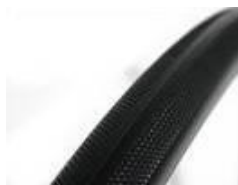
Opona odporna na przebicia