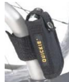
Kieszka na telefon