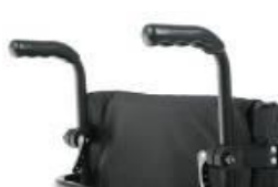
Uchwyt z regulacją wysokości