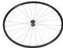
Koło lekkie, 24 szprychy, splot prosty