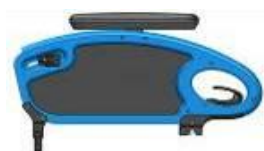
Podłokietnik przystolkowy ze stałą wysokością