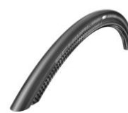
Opona pneumatyczna, Schwalbe One