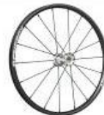
Koło Spinergy, 18 szprych, splot prosty