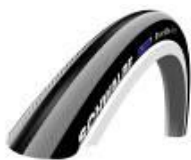
Opona pneumatyczna, gładki bieżnik, Schwalbe