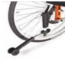
Kółko antywywrotne, odchylane, lewe