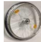
Koło z ham. bębnowym, 36 szprych, splot krzyżowy