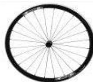
Koło Proton, 24 szprychy, splot prosty