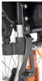
Oparcie z reg. kąta