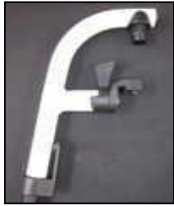
Aluminiowe ramię podnóżka