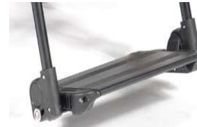
Aluminiowa platforma z reg. kąta i głębokości, podnoszona