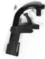
Plastikowe ramię podnóżka