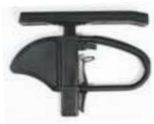
Podłokietnik na słupku z reg. wysokości