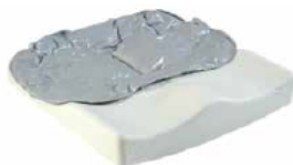
Jay Easy Fluid (zdjęcie nie pokazuje tapicerki)