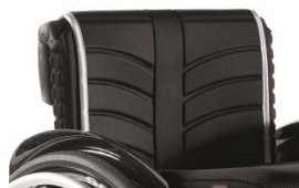
LI030316 Tapicerka EXO standardowa