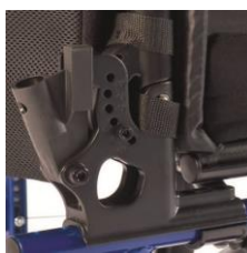
Oparcie z regulacją kąta