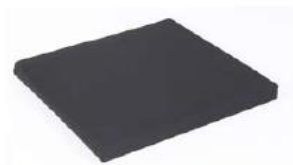
Poduszka na siedzisko z czarnym pokrowcem na suwak