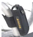
Kieszonka na telefon