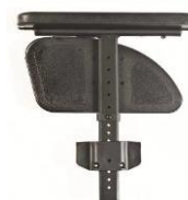
Podłokietnik na słupku z reg. wysokości przy pomocy narzędzi