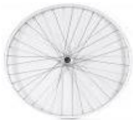
Uniwersalne koło ze splotem krzyżowym