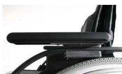
Podłokietnik z reg. wysokości przy pomocy narzędzi