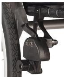
Hamulec z dźwignią na wys. kolan