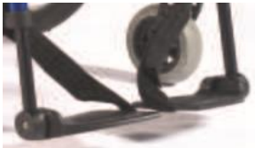
Podzielone plastikowe platformy podnóżka z reg. kąta