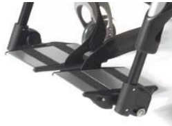
Aluminiowe podzielone platformy podnóżka z reg. kąta i głębokości